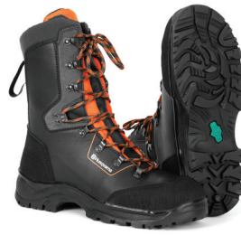
SCHUTZSTIEFEL CLASSIC 20M/S 597 65 94-39