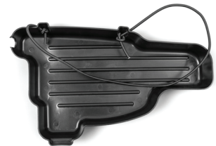
KETTENSÄGENUNTERSATZ 536 94 48-01