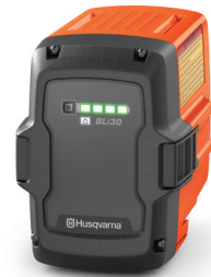
AKKU BLI30 967 93 77-01