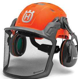
SCHUTZHELM TECHNICAL 585 05 84-01