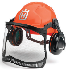
SCHUTZHELM CLASSIC 580 75 43-01