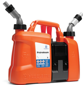
KOMBIKANISTER 5+2.5 LITER 580 75 42-01