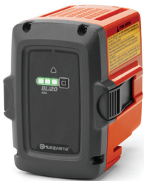
AKKU BLI20 967 09 17-01