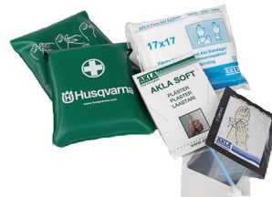
ERSTE-HILFE-KIT 504 09 53-01