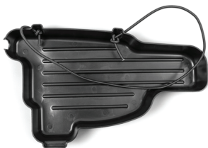
KETTENSÄGENUNTERSATZ 536 94 48-02