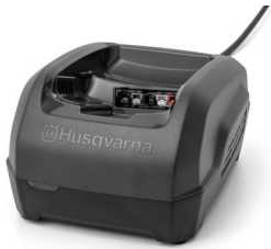
AKKU-LADEGERÄT QC250 967 97 01-01