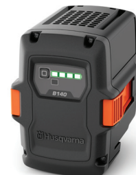
AKKU 40-B140 970 45 72-01