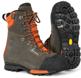
SCHUTZSTIEFEL FUNCTIONAL 24M/S 597 65 93-38