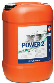
HUSQVARNA XP® POWER 2 583 95 29-02