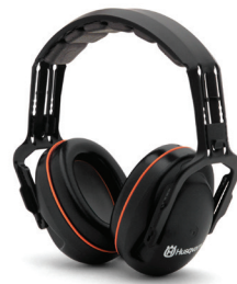
GEHÖRSCHUTZ 505 66 53-04